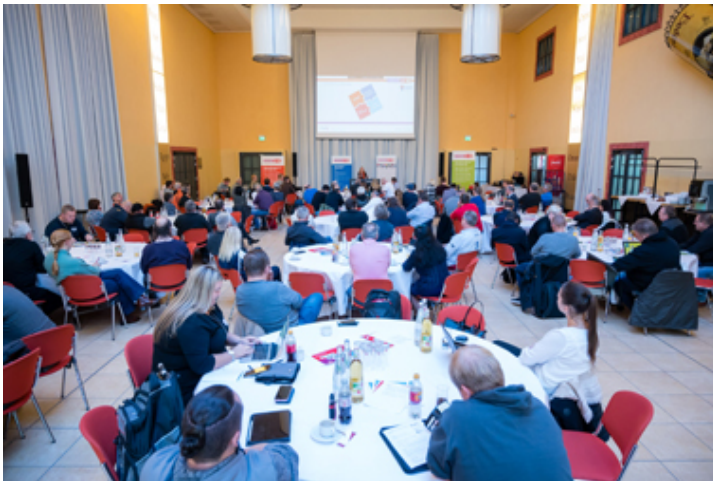
Rege Beteiligung auf der 4. Zukunftswerkstatt.

Gleichzeitig beschließen die Tarifkommissionen am 7. Februar 2023 auf dieser Basis die Höhe einer gemeinsamen Entgeltforderung, die in allen Unternehmen durchgesetzt werden soll, sowie die Laufzeit, die für den neuen Tarifvertrag gefordert wird. Damit stehen dann die Zentralen Forderungen fest, die unsere gemeinsame „Tarifrunde 2023“ prägen werden. Am Ende der „Tarifrunde 2023“ gilt unser Abschluss in allen Unternehmen bei Bus und Bahn, in denen die EVG Tarifverträge unterzeichnet und ist damit maßgebend für die Branche.